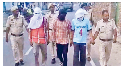
सिरसा। आरोपियों को गांव में घुमाती पुलिस।