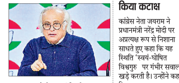
एजेसी नई दिल्ली

पश्चिम एशिया में शांति बहाली की उम्मीदों के बीच कांग्रेस ने भारत सरकार की कूटनीतिक विफलताओं पर सवाल उठाए हैं। पार्टी ने विशेष रूप से इस बात पर चिंता व्यक्त की है कि कैसे पाकिस्तान, जिसे अप्रैल 2025 के पहलगाम आतंकी हमले के बाद भारत द्वारा अलग-थलग करने के प्रयास किए गए थे, अब अमेरिका और ईरान के बीच मध्यस्थ की भूमिका निभा रहा है। कांग्रेस नेता ने एक्स पर एक पोस्ट में लिखा कि अमेरिका-ईरान की बैठक इस्लामाबाद में शुरू हो रही है और पूरा विधान, जिसमें भारत भी शामिल है, उम्मीद कर रहा है कि यह दोनों देशों के बीच एक स्थायी शांति प्रक्रिया की शुरुआत होगी, जो इजराइल की अपने पड़ोस में निरंतर आक्रामकता से पटरी से न उतरे।