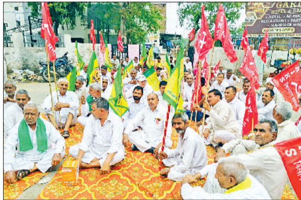
फतेहाबाद। फसलों की नई खरीद नीतियों के खिलाफ रोड पर धरना देते किसान।

प्रदेश में रबी सीजन की फसल खरीद से जुड़े नए नियमों के विरोध में शनिवार को किसानों ने बड़े स्तर पर प्रदर्शन करते हुए कई जिलों में सड़क और हाइवे जाम कर दिए। संयुक्त किसान मोर्चा के बैनर तले हुए इस आंदोलन का असर राज्य के अलग-अलग हिस्सों में देखने को मिला, जहां सुबह 11 बजे से दोपहर 3 बजे तक किसान सड़कों और अनाज मंडियों में डटे रहे। सबसे ज्यादा असर हांसी में देखने को मिला, जहां किसानों ने रामायण टोल प्लाजा पर कब्जा कर लिया और सभी लेन बंद करा दीं। टोल पर